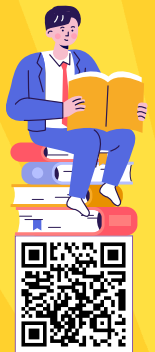
▲ 학과 정보

커리어넷( www.career.go.kr ) > 학과정보 > '웹툰', '만화' 검색