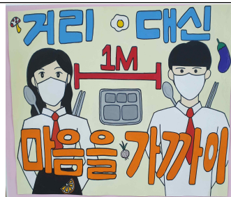
3학년 김민주, 이은아