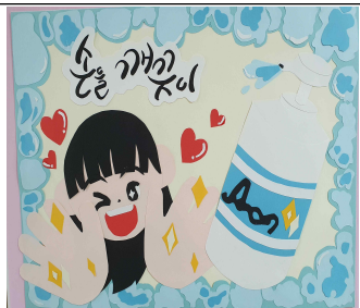
3학년 김유이, 임민경, 최수희