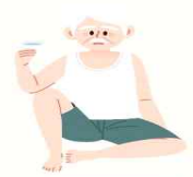
물 자주 마시기

외출시 마스크 착용 및 실내 습도를 40~50% 유지하고 물을 자주 마시는 것이 비염 예방에 도움이 됩니다.