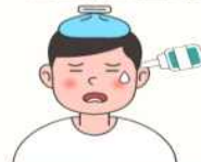
인공눈물 사용, 눈 주위 냉찜질하기

눈 주변의 화끈거림을 동반한 통증, 가려움, 충혈, 눈물 등의 증상이 주로 발생하고, 결막부종이나 눈꺼풀이 부푸는 증상이 동반되어 나타날 수도 있어요.