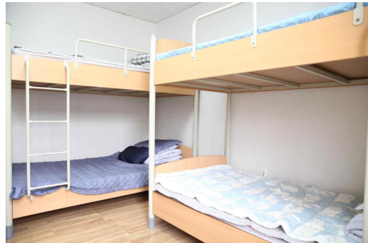
<4인 1실 2층 침대: 매트리스 사이즈-약 1m X 2m>