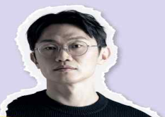
윤덕원 가수 브로콜리 너마저