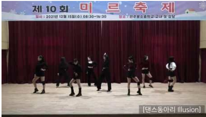
< 사진자료: 2021 미르축제 공연사진 >