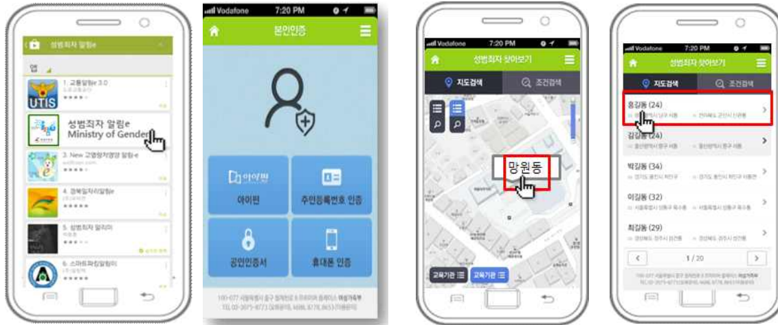
① 앱스토어에서 '성범죄자 알림e' 앱 검색