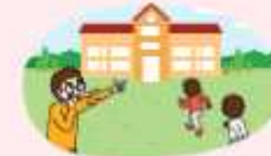
운동장 등 실외활동 시 실내 또는 지정된 대피 장소로 신속히 이동