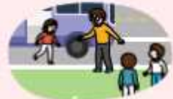
현장학습 등 차를 타고 이동 중에는 가까운 공터, 도로 오른쪽 정차 후 안전한 곳으로 대피