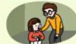
마음이 불안한 학생은 선생님에게 알리기