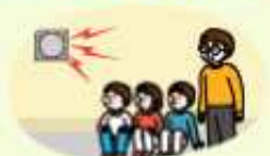
교내 방송 또는 라디오 방송 잘 듣기