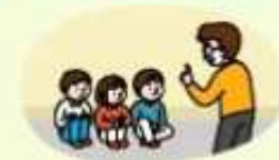
대피장소에 머물며 침착하게 행동하기