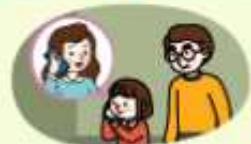
선생님 안내에 따라 부모님께 연락하기