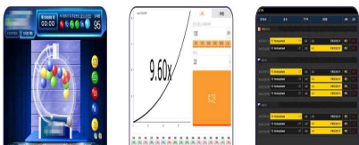
파워볼 / 소셜 그래프 / 불법 스포츠 도박