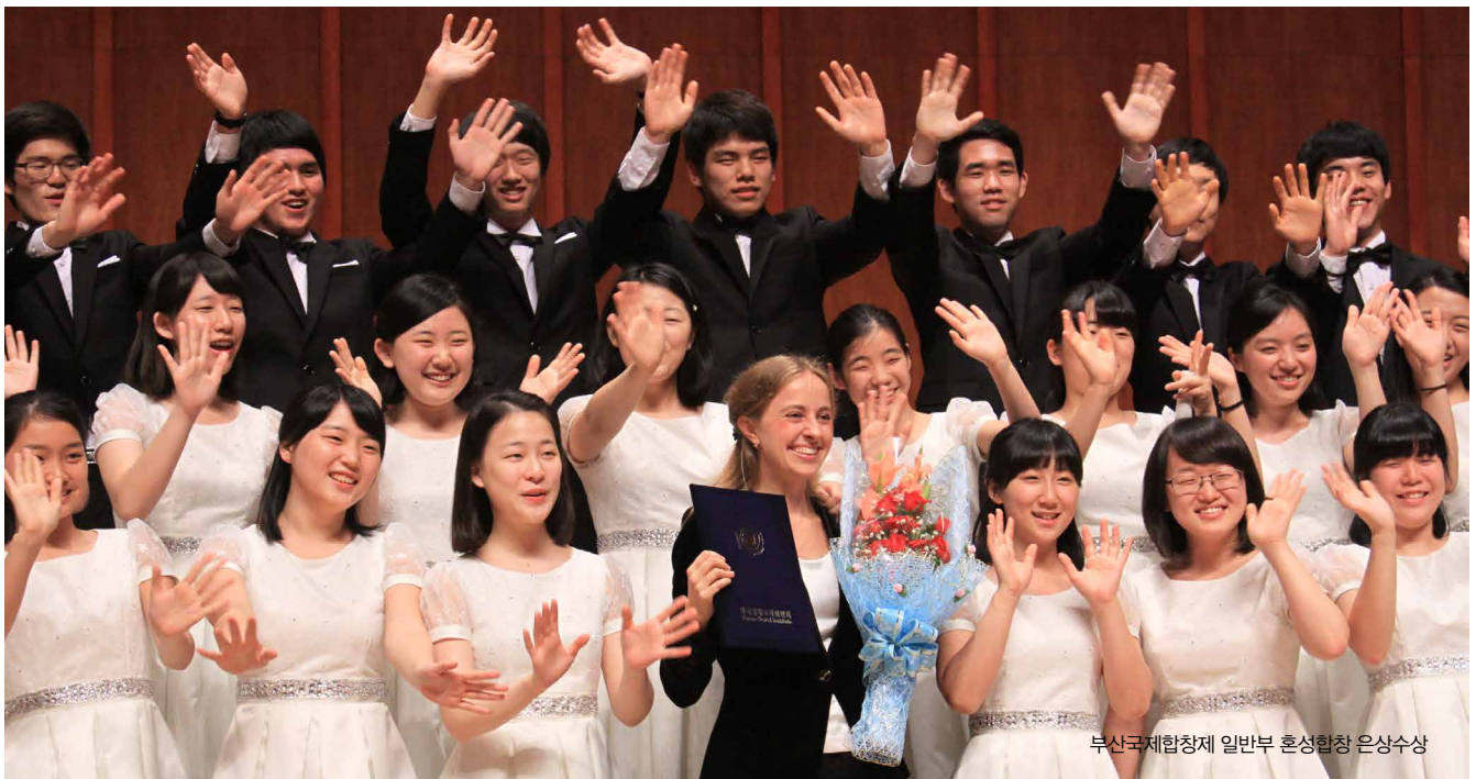
부산국제합창제 일반부 혼성합창 은상수상

그라시아스 음악학교는 국내외 정상급 교수진과 능력있고 경험이 풍부한 강사진으로 구성되어 학생 개개인이 무한한 잠재력을 최대한 계발할 수 있도록 훌륭한 음악 교육 환경을 제공하고 있다.