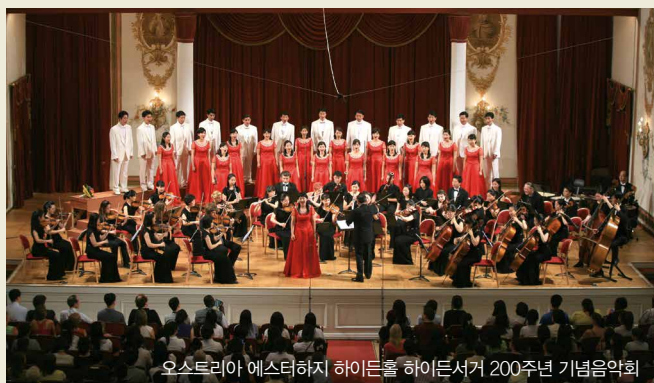
오스트리아 에스터하지 하이든홀 하이든서거 200주년 기념음악회

현시대에서 수많은 음악가에 비해 연주할 무대가 없다는 것은 모두에게 공감되는 현실이다. 그라시아스 음악학교 학생들은 다양한 공연을 통해 폭넓은 무대 경험을 쌓고 전문음악인으로서 갖춰야 할 연주능력을 기를 뿐 아니라, 음악을 표현할 수 있는 기회를 제공받는다.