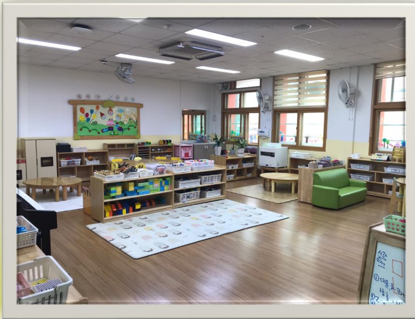
- 열매반(5세) -