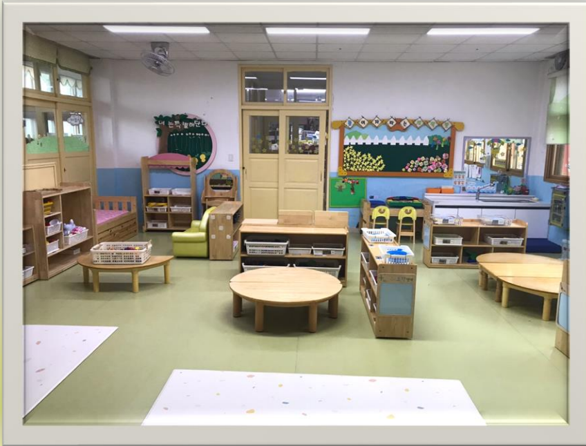
- 새싹반(3세) -