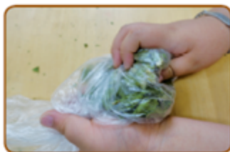
2단계 말린 낙엽을 비닐봉투에 넣고 비벼준다.