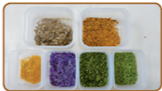
3단계 낙엽가루 완성!