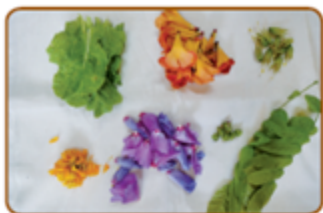
1단계 다양한 색의 낙엽을 모아 말린다.