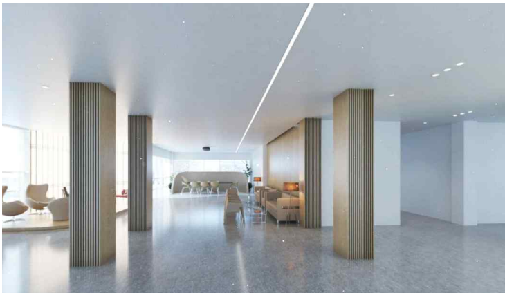
임실고 그린스마트스쿨 조성 중 인테리어(안)