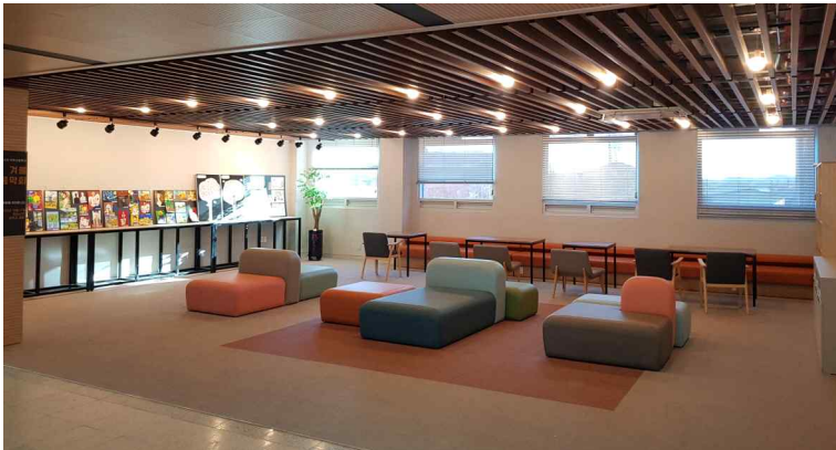
경기 미래학교 공간혁신 사우고