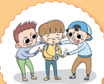
돈이나 물건을 빼앗는 행위