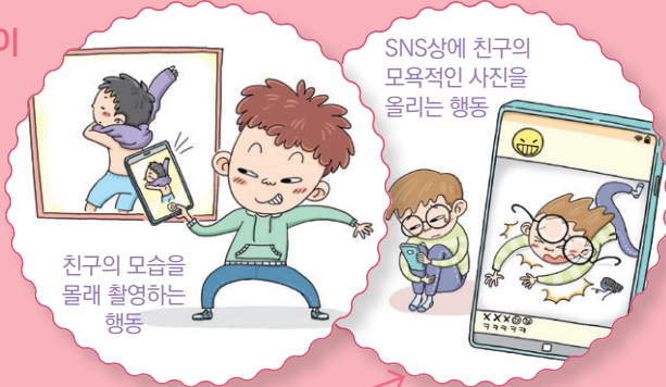
친구의 모습을 몰래 촬영하는 행위

※ 학교폭력은 학생의 신체·정신·재산상의 피해를 수반하는 모든 행위를 포함해요