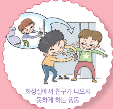
화장실에서 친구가 나오지 못하게 하는 행위