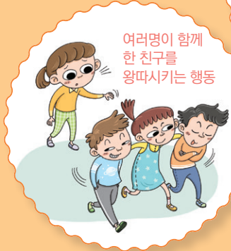
여러명이 함께 한 친구를 왕따시키는 행위