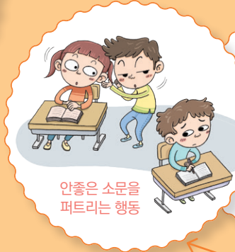
안좋은 소문을 퍼트리는 행위