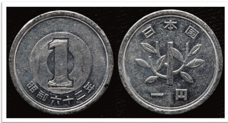
▲ 1엔 짜리 동전의 앞과 뒤

일본의 화폐 단위는 엔(えん, 円)이다. 물건을 살 때마다 소비세를 내야 하므로 동전을 자주 사용한다.