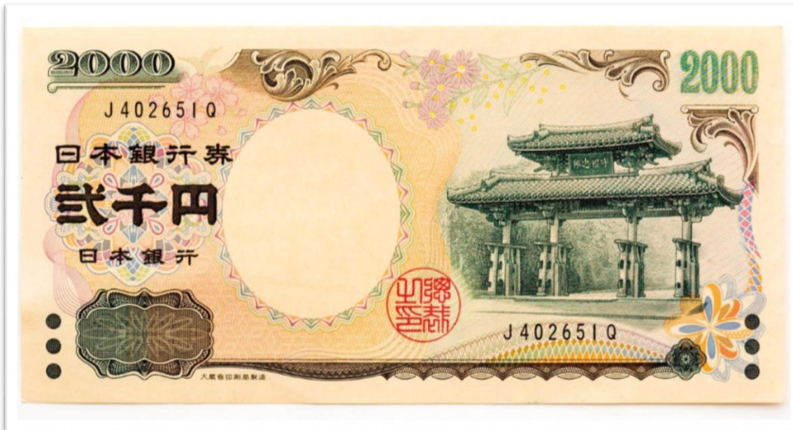
◀ 2,000엔 짜리 지폐