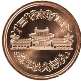
▲ 10엔 짜리 동전의 앞과 뒤