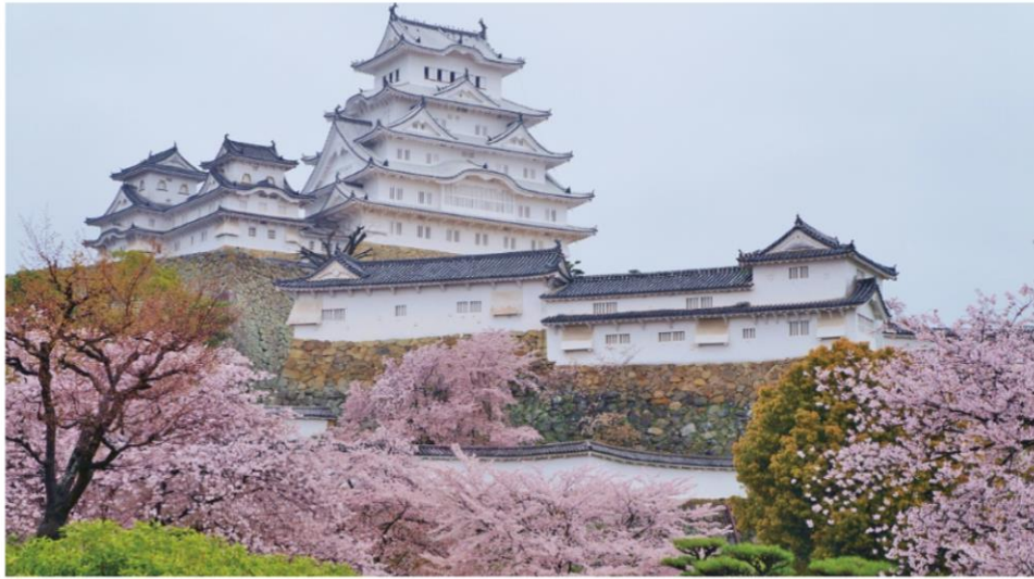
◀ 히메지. 히메지성