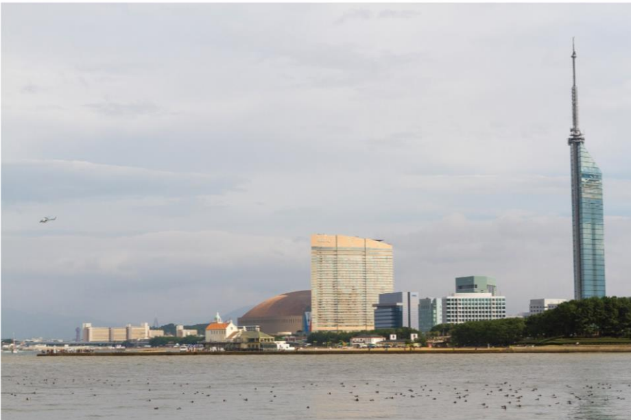
◀ 후쿠오카. 후쿠오카 돔 과 후쿠오카 타워