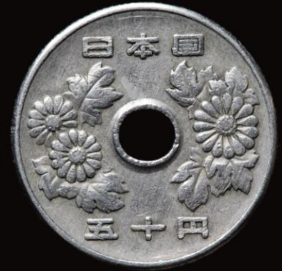
▲ 50엔 짜리 동전의 앞과 뒤