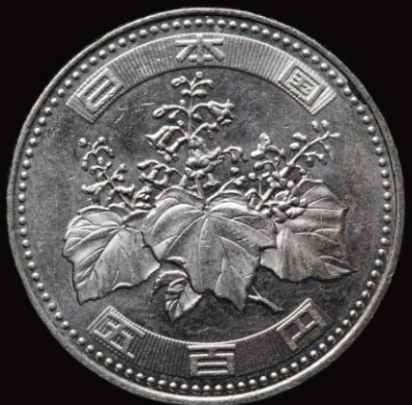
▲ 500엔 짜리 동전의 앞과 뒤