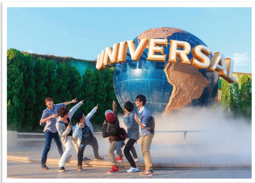
◀ 오사카. 유니버설 스튜디오 오재팬