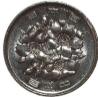
▲ 100엔 짜리 동전의 앞과 뒤