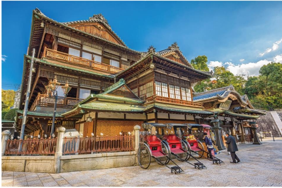
◀ 마쓰야마. 도고 온천