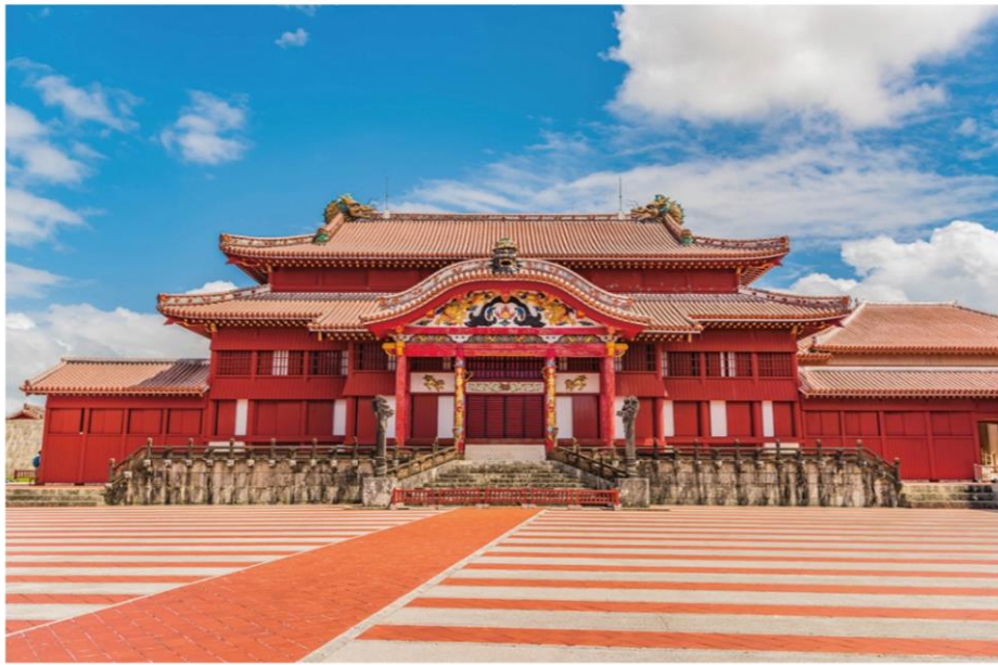
◀ 오키나와의 나하. 슈리성