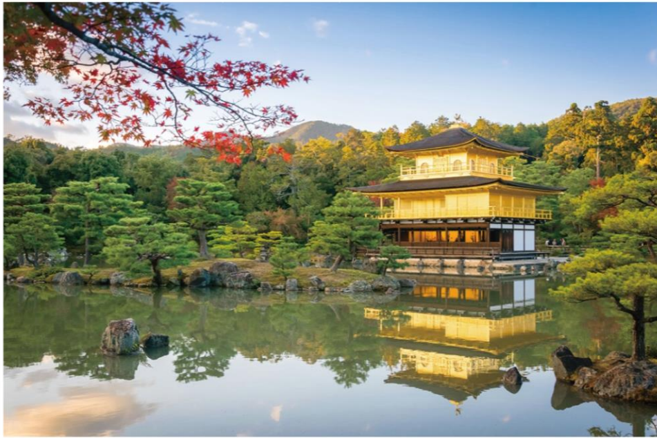
◀ 교토. 긴카쿠지