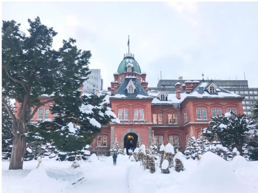
◀ 삿포로. 구 홋카이도 청사