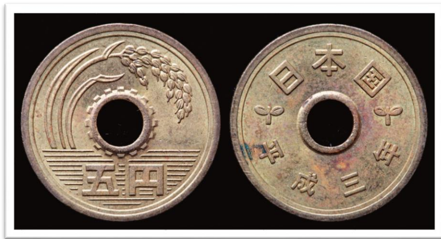
▲ 5엔 짜리 동전의 앞과 뒤