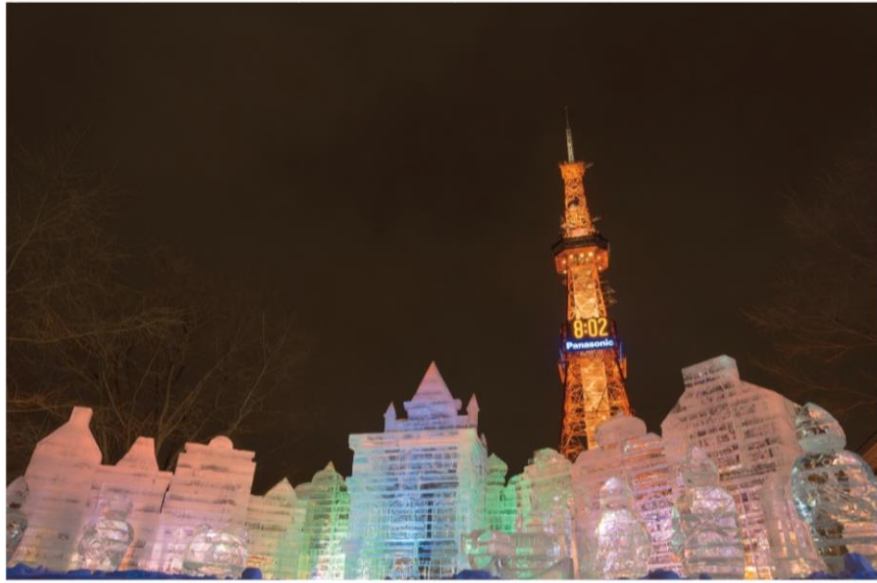
◀ 홋카이도의 삿포로. 삿포로 텔레비전 타워와 유키마쓰리