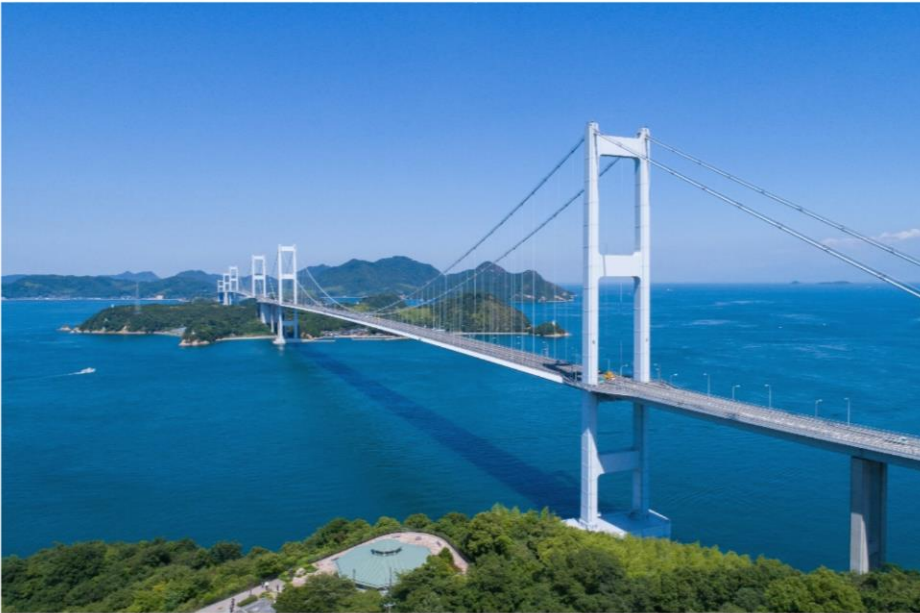
◀ 시코쿠. 세토 대교