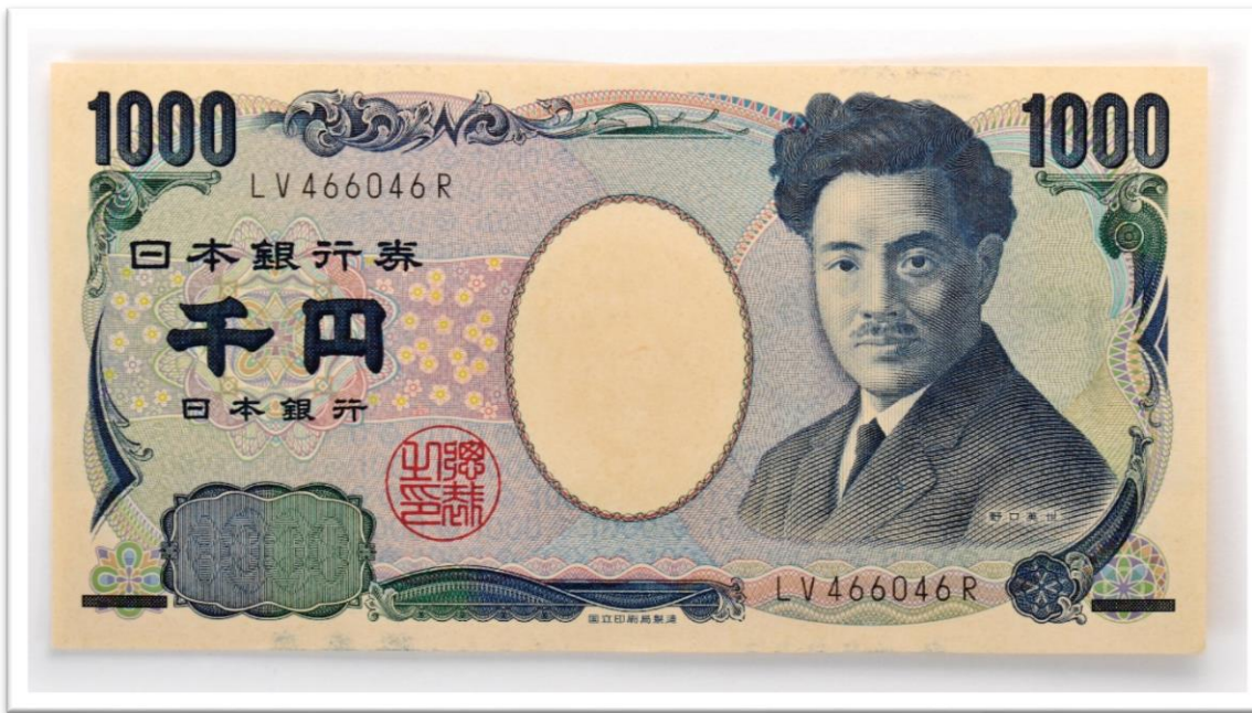
◀ 1,000엔 짜리 지폐