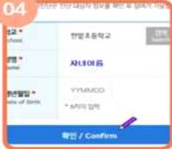
자녀 이름, 생년월일, 개인정보제공 동의 후 비밀번호 등록 비밀번호 4자리 꼭 기억!