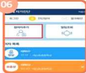
다자녀의 경우 참여자 추가를 클릭하여 같은 과정 반복