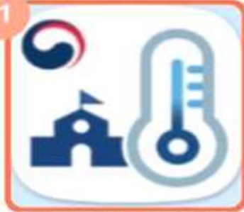
건강상태 자가진단 (교육부) 앱 설치