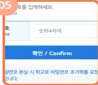
비밀번호 등록 이후에는 비밀번호만 입력하면 로그인됨