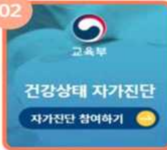
초기화면 자가진단 참여하기 클릭