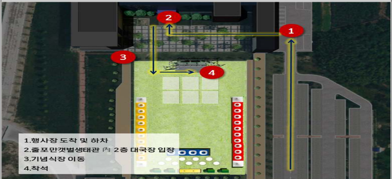
장관님 이동 동선도