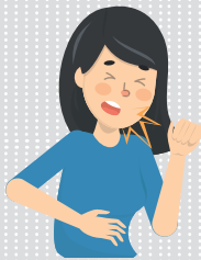
기침 많이 함