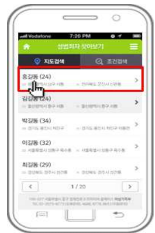
④ 성범죄자 확인