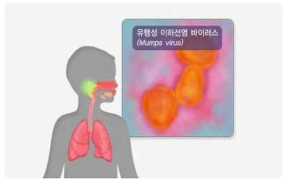
〈그림 유행성 이하선염〉

유행성이하선염은 흔히 '볼거리'라고도 하며 이하선(귀 아래의 침샘)이 부어오르고 열과 두통이 동반 되는 전염성 바이러스성 질환입니다. 유행성이하선염은 환자가 기침이나 재채기를 할 때 나오는 호흡기 분비물을 통해 전파되거나 환자와의 직접적인 접촉을 통해 전염 될 수 있으며, 잠복기는 보통 14~18일 정도이며 25일까지 길어질 수 있습니다. 전염력이 가장 높은 시기는 증상 발현 1~2일전부터 발현 5일 후까지이며, 증상 발현 5일까지는 호흡기 격리가 필요하므로 이 기간에는 자택격리를 실시 합니다. 유행성이하선염의 가장 흔한 증상인 이하선염외에도 뇌수막염, 고환염, 난소염, 췌장염 등의 합병증이 나타날 수 있으나 대부분의 건강한 아이들은 특별한 합병증을 남기지 않고 회복이 됩니다.