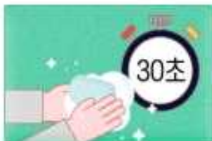
비누로 30초 이상 흐르는 물에 손 씻기