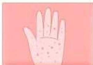
좁쌀 모양 발진