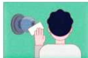
문 손잡이, 장난감 자주 소독하기

! 의심증상 시 빠르게 병원 진료를 받고, 항생제 치료 후 최소 24시간 등원·등교를 금지해 주세요.