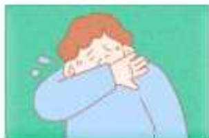
기침할 땐 옷소매로 가리기