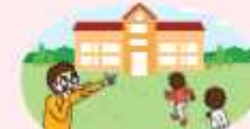
운동장 등 실외활동 시 실내 또는 지정된 대피 장소로 신속히 이동