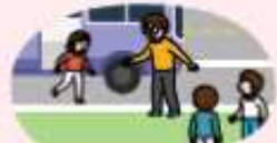
현장학습 등 차를 타고 이동 중에는 가까운 골짜기, 도로 오른쪽 정차 후 안전한 곳으로 대피