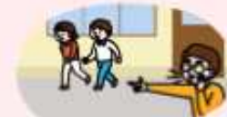
선생님과 지정된 대피장소로 이동