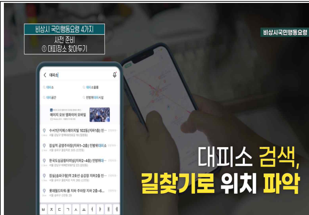
민방위 대피소 찾기

□ 교육 영상 “비상시 국민행동요령(6분 40초)”, 안전한TV 게시 및 추후 송부 예정