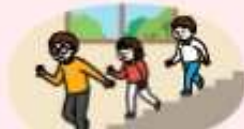
계단을 이용하고 뛰거나 뛰지 않기 (엘리베이터 이용 금지)