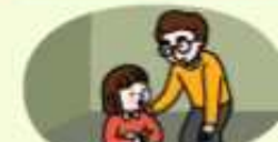
마음이 불안한 학생은 선생님에게 알리기