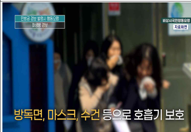
화생방경보 시 행동요령