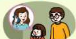
선생님 안내에 따라 부모님께 연락하기