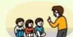
대피장소에 머물며 침착하게 행동하기