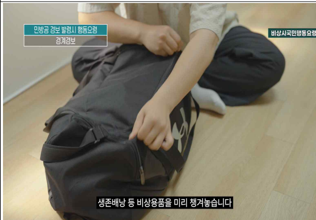
경계경보 시 행동요령