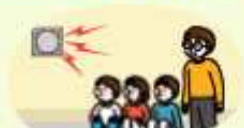
교내 방송 또는 라디오 방송 잘 듣기