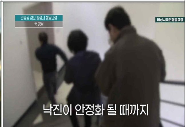
핵경보 시 행동요령