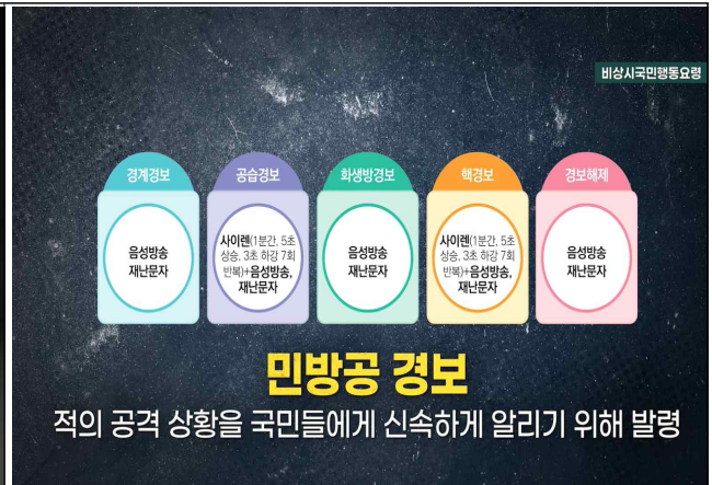
민방공 경보 안내