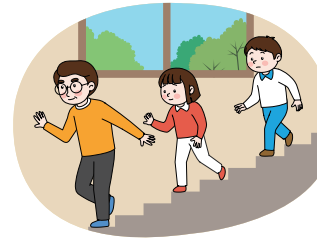
계단을 이용하고 밀거나 뛰지 않기