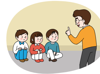
대피장소에 머물며 침착하게 행동하기