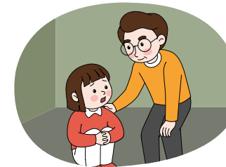
마음이 불안한 학생은 선생님에게 말하기