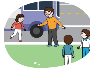
현장학습 등 차를 타고 이동 중에는 가까운 공터, 도로 오른쪽 정차 후 안전한 곳으로 대피