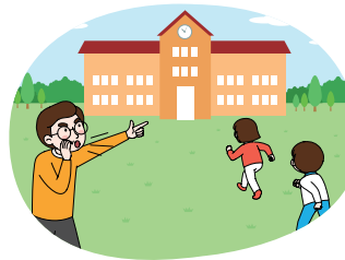
운동장 등 실외활동 시 실내 또는 지정된 대피 장소로 신속히 이동