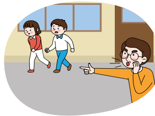
선생님과 지정된 대피장으로 이동