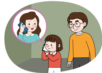
선생님 안내에 따라 부모님께 연락하기