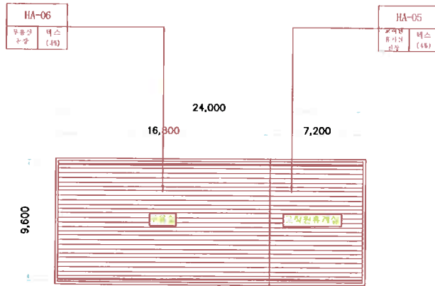
월명중학교 2동 지상2층 평면도