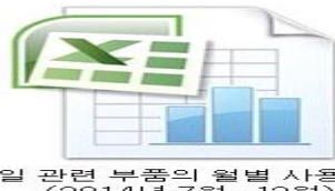
오일 관련 부품의 월별 사용 현황 (2014년 7월~12월)