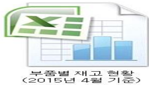
부품별 재고 현황 (2015년 4월 기준)