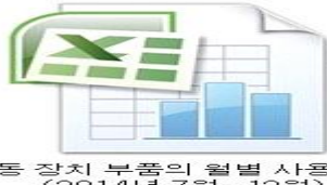
제동 장치 부품의 월별 사용 현황 (2014년 7월~12월)