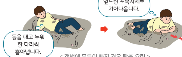
< 갯벌에 무릎이 빠진 경우 탈출 요령 >