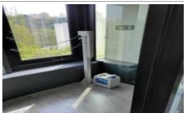
식당 내 완강기 설치된 모습