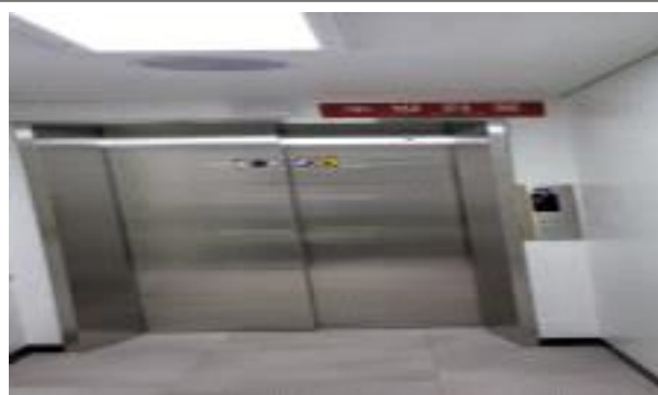
소방 전용 엘리베이터 설치된 모습