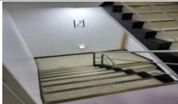
비상 계단 모습