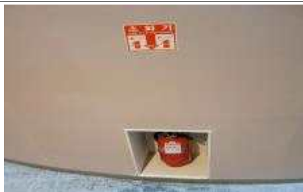
복도에 설치된 소화기(총 4대 설치되어 있음)