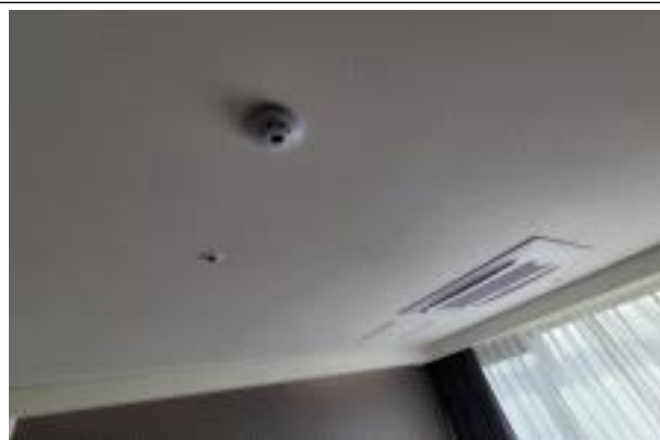
객실 내 화재감지기, 스프링클러 설치된 모습