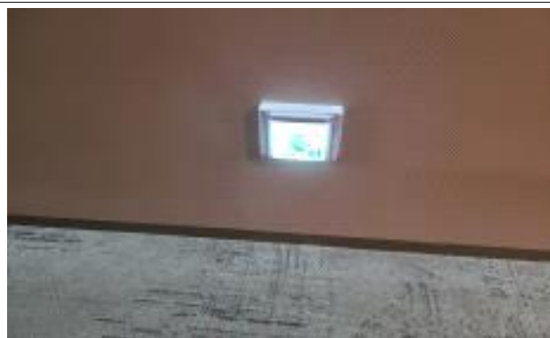
복도에 설치된 비상구 표시등