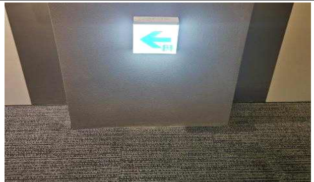
복도에 설치된 비상구 표시등