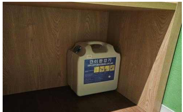
객실 내 완강기 모습