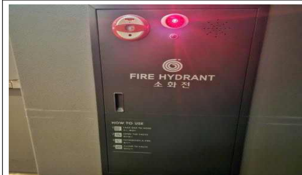
복도에 설치된 소화전(소화기는 5대 설치되어 있음)