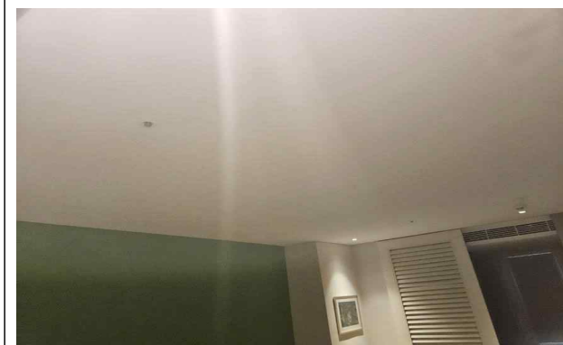
객실 내 화재감지기, 스프링클러 설치된 모습