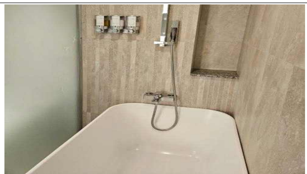
객실 내 화장실 모습(드라이기, 샴푸, 린스 보유)