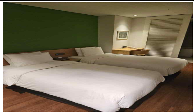
2인실 객실 모습(싱글베드2)