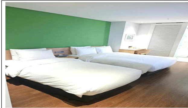
3인실 객실 모습(트윈베드1, 싱글베드1)