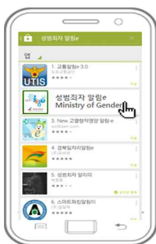
① 앱스토어에서 '성범죄자 알림e' 앱 검색