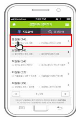
④ 성범죄자 확인