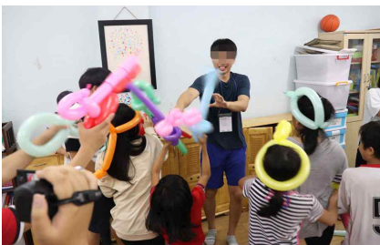
해외봉사 및 문화탐방