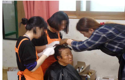
마을 염색 봉사