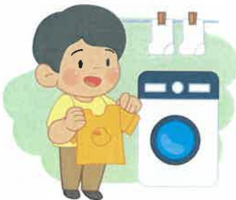
4 옷 털고, 세탁하고