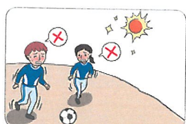
3 더운 시간대에 휴식을 취한다.(운동장 등 실외활동을 자제한다.)