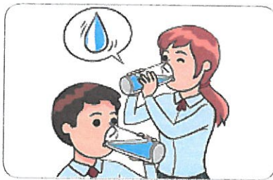
1 물을 자주 적당히 마신다.