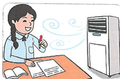
2 시원하게 지낸다.