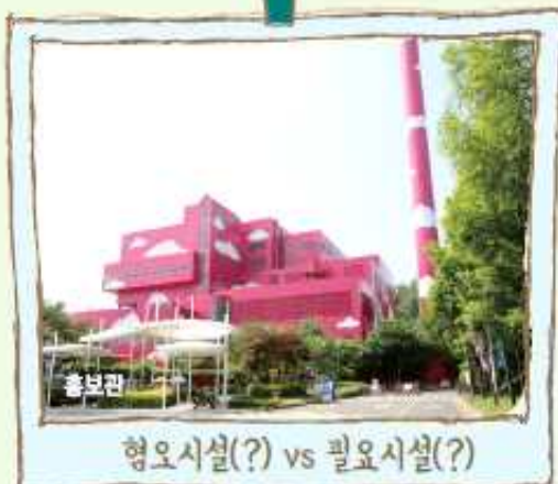
형오시설(?) vs 필요시설(?)