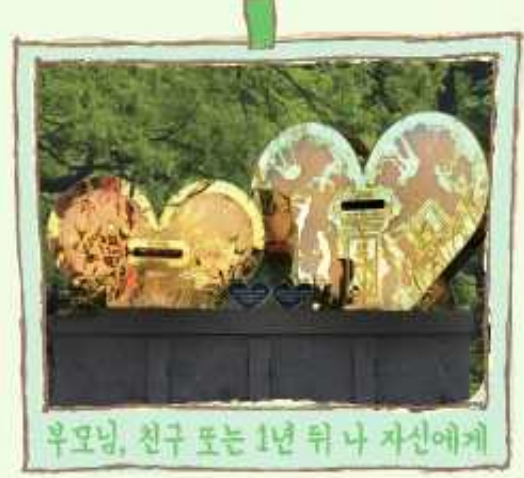
우모닝, 친구 또는 1년 뒤 나 자신에게