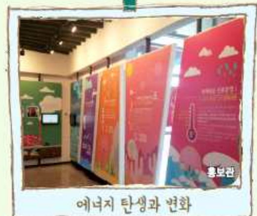
에너지 탄생과 변화

물, 바람, 태양열, 원자력 등 다양한 에너지의 활용과 친환경적인 미래 에너지를 살펴본다