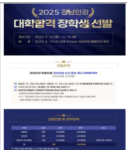
강남인강 교육나눔 장학생 선발