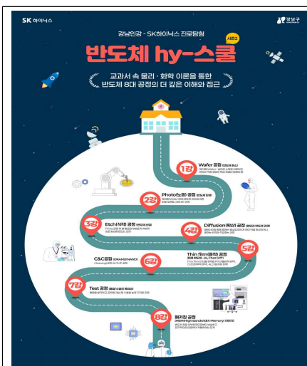
강남인강-SK하이닉스 진로 특강