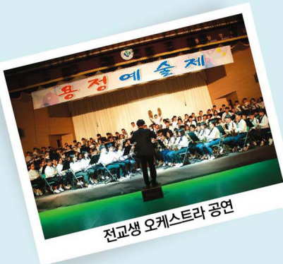
전교생 오케스트라 공연

SBS(KBC) 이슈인뉴스 방송 2016.03.14. 창의성과 인성을 동시에 기르는 특별한 교육시스템, 용정중학교