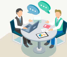
교육부 관계자·교사·교수·학부모 및 시민 단체·교과서 유관기관 임직원·교육 전문가