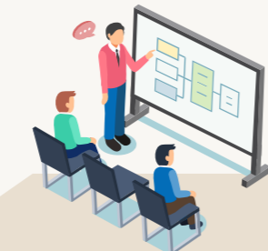
현장 교사·교과별 전문가·전문기관 연구자