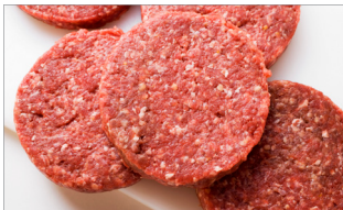
쇠고기(특히 간 쇠고기, 햄버거) 및 쇠고기 육제품(햄, 소시지)