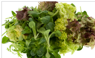
시금치, 상추 등 생채소, 새싹채소 및 샐러드, 과일