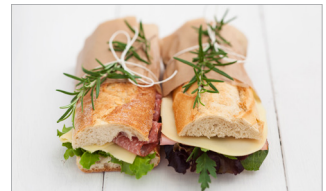
보균자에 의해 조리된 식품 (도시락, 샌드위치)