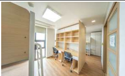
전주대 스타타워 기숙사