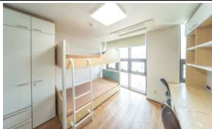
전주대 스타타워 기숙사