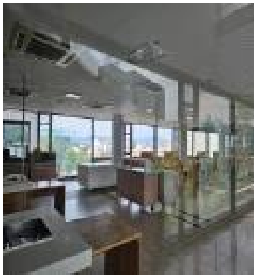
스타타워 기숙사 식당