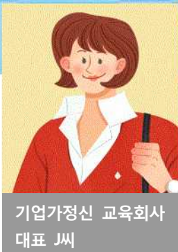
기업가정신 교육회사 대표 J씨