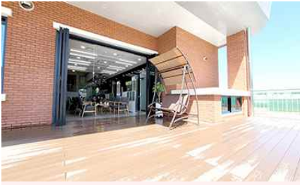
1층 야외 테라스