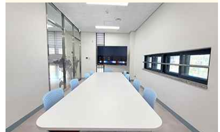
2층 회의실, 공부방