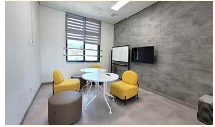
2층 동아리 2실