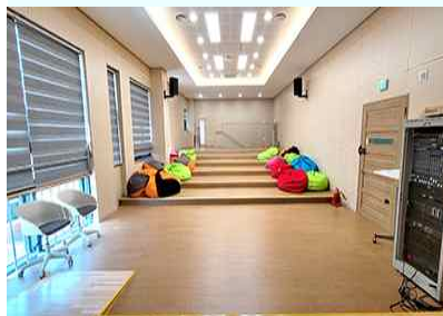
3층 영상 미디어실