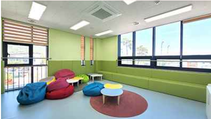
2층 보드게임, 놀이실