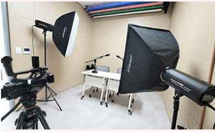
2층 방송 스튜디오