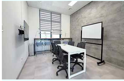
2층 동아리 1실