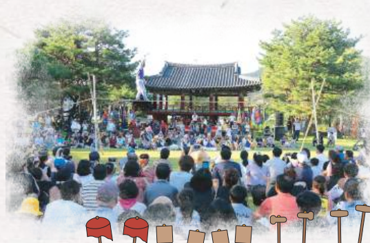
◀ 행사 사진