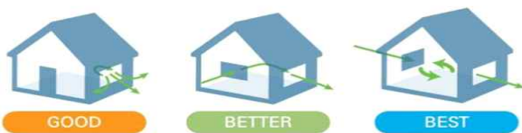
[자연환기 방식별 환기효과 비교]