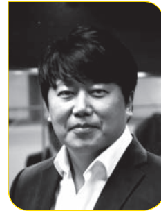
성악 설 성 엽