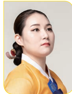
국악 주 사 랑