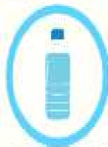
충분한 수분 섭취