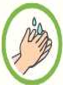
손 자주 씻기