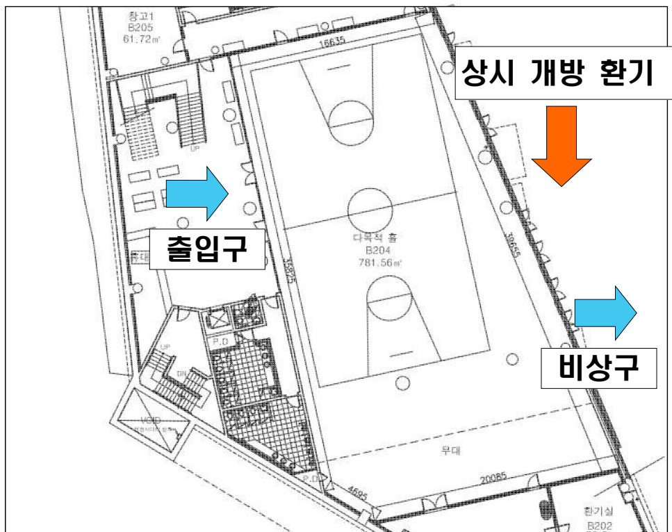
[대학별 상담부스 (하림미션홀)]