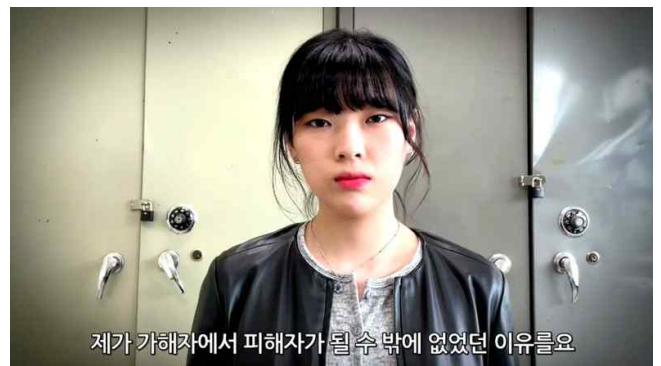
영화 <루머의 루머의 루머> 패러디 <복수의 복수의복수>(1"00)