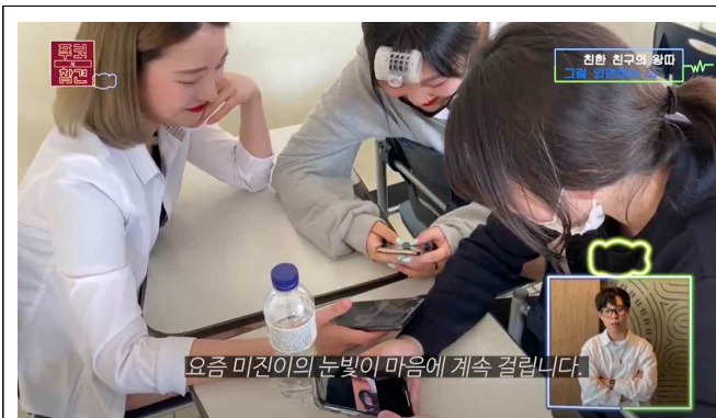
TV예능 <연애의 참견> 패러디 <푸코의 참견>(2"03)