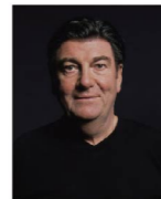
페터 제츠(Peter Zec) 레드닷 회장

디자인 분야의 학술단체와 협회, 산업계, 광주의 디자인계가 중심이 되어 다양한 발표와 토론으로 진행 - 주제 : 뉴노멀 시대에서의 디자인(Design in the Era of New Normal)