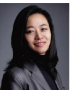
윤송이 엔씨소프트 사장 (최고전략책임자, CSO)