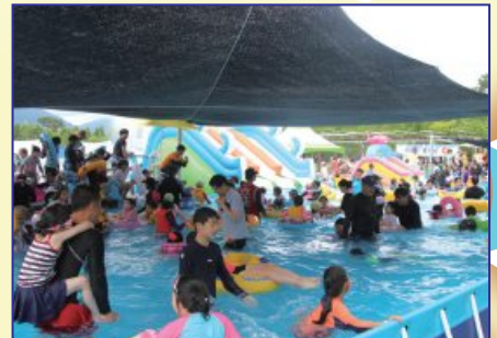
※ 위의 사진은 2022년도 물 과학 체험장 운영 사진입니다.