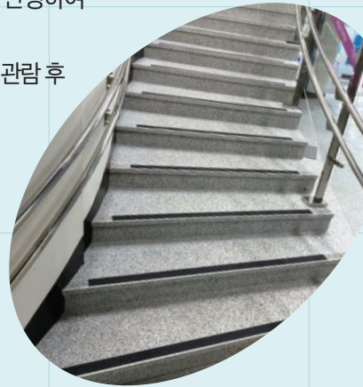
인공지능관 미끄럼 패드 시공