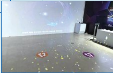
특별전 발바닥 표시 부착으로 대기자 편의 제공

'사이언스맘 클럽'은 학부모의 니즈와 참신한 아이디어를 전시·행사·교육프로그램에 반영하여 서비스 품질과 고객만족도를 높이는 국민 참여형 소통강화 프로그램입니다. 4월 본격적인 활동을 시작으로 현재까지 인공지능관, 공동특별전 '각양각색 컬러나라'를 관람 후 25건의 운영 개선사항을 발굴하고, 블로그에 전시와 행사를 소개하는 등 국립광주과학관의 발전을 위해 활동하고 있습니다.