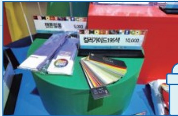
특별전 기념품 종류 다양화