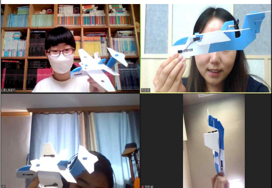
비행기의 원리와 전동 글라이더 수업