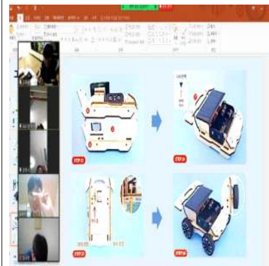
태양광 자동차 만들기 수업