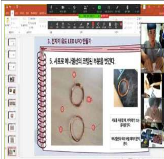
전자기 유도 LED UFO 수업