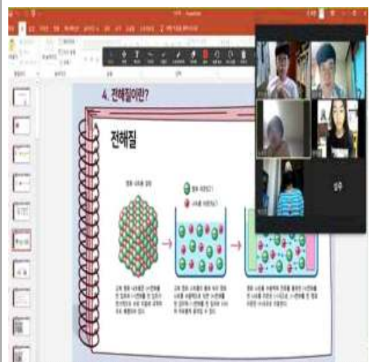
전해질 개념 이론 수업