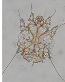
그림 1. 수컷 옴 2)