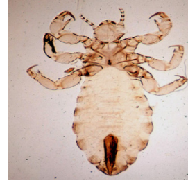
그림 1. 머릿니 10)